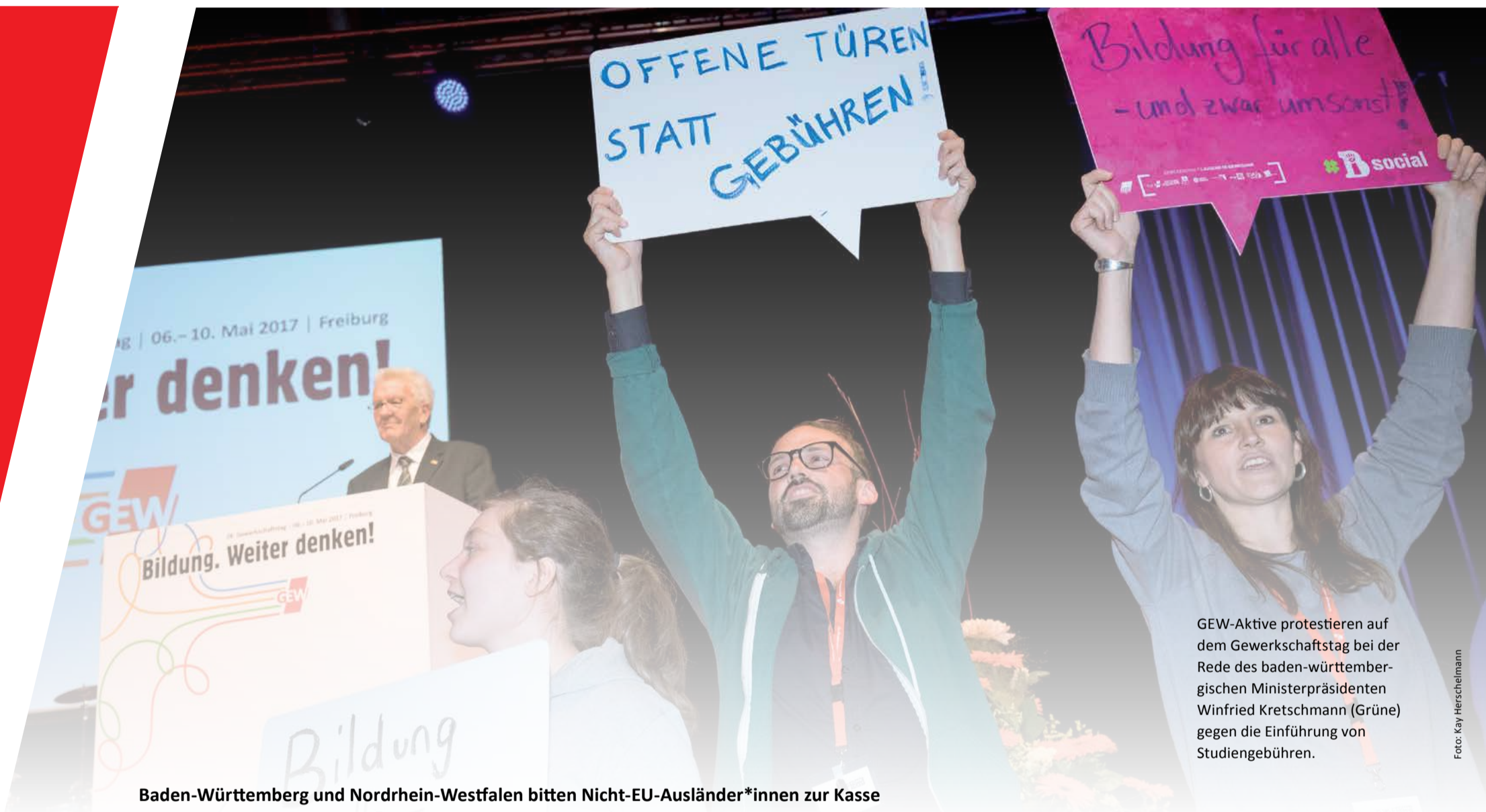
GEW-Aktive protestieren auf dem Gewerkschaftstag bei der Rede des baden-württembergischen Ministerpräsidenten Winfried Kretschmann (Grüne) gegen die Einführung von Studiengebühren.

// ZEITUNG FÜR STUDIERENDE • WINTERSEMESTER 2017 //