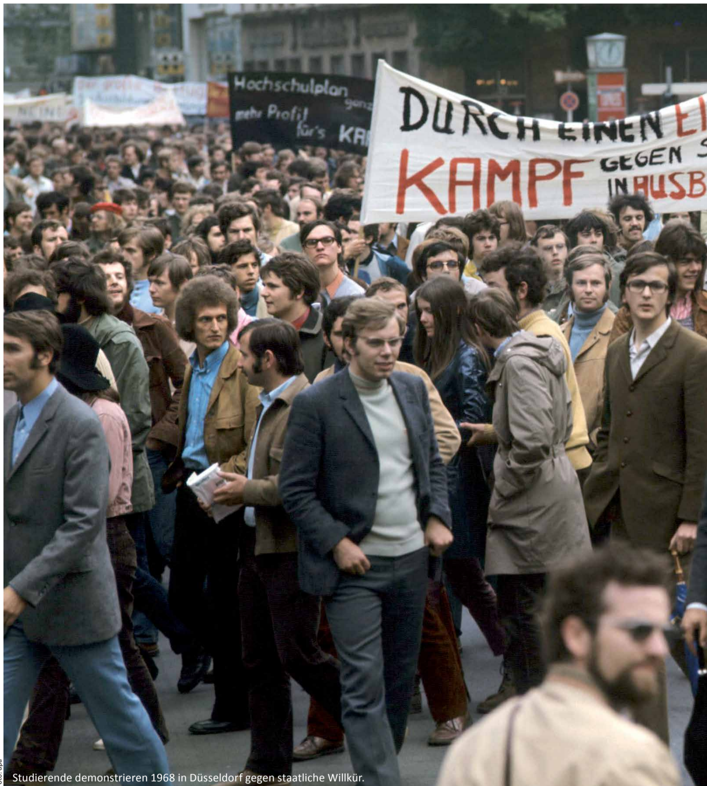
Studierende demonstrieren 1968 in Düsseldorf gegen staatliche Willkür.